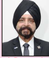
डिस्ट्रिक्ट गव्हर्नर रो. राजिंदरसिंग खुराना